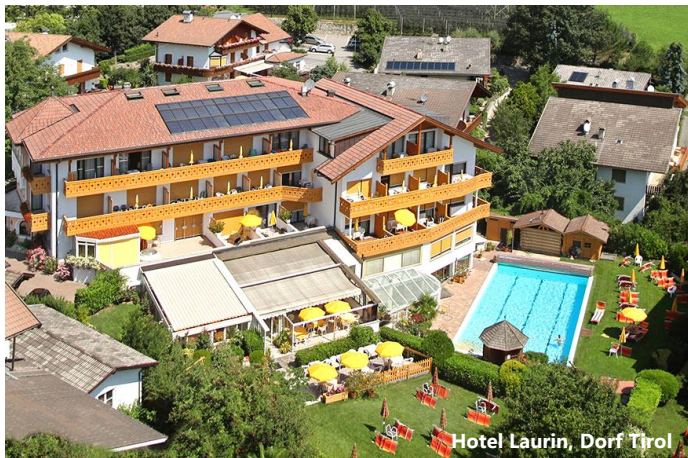
Hotel Laurin, Dorf Tirol

Frühling: Samstag 7. – Dienstag 10. April 2018 / 4 Tage